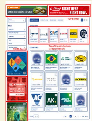
Online-Anzeige im Ausstellerverzeichnis