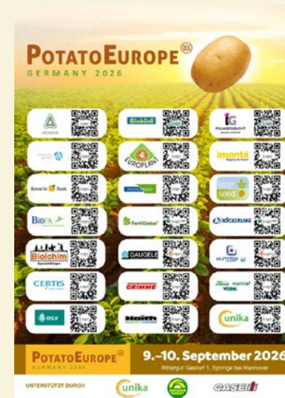
Logo + QR-Code auf der Ausstellerseite in der Zeitschrift